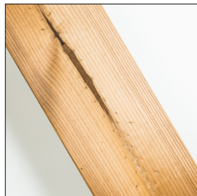
Dřeňové záběhy jsou povoleny