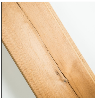
Malé praskliny na povrchu prken jsou povoleny

Produkty ThermoWood vyrobené z borovice a smrku, mají své charakteristické vlastnosti, které jsou uvedeny v ilustraci níže.