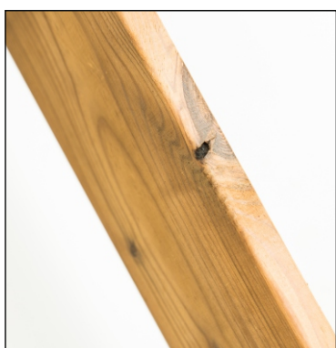
Malé volné suky na hranách prken jsou povoleny