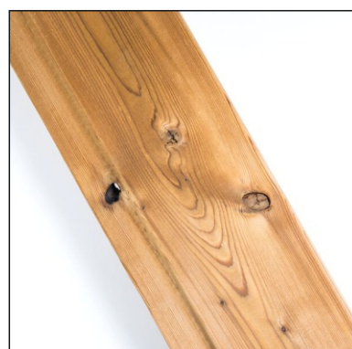
Malé otvory po vypadlých sucích jsou povoleny