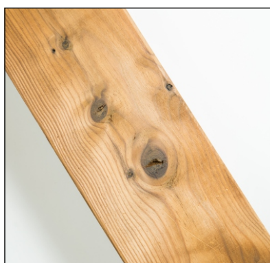
Praskliny v sucích jsou povoleny