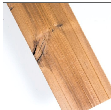
Praskliny kolem suků jsou povoleny