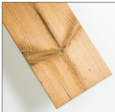
Trhliny na koncích prken jsou povoleny