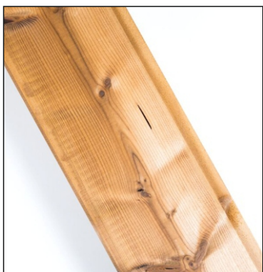
Smolníky jsou povoleny