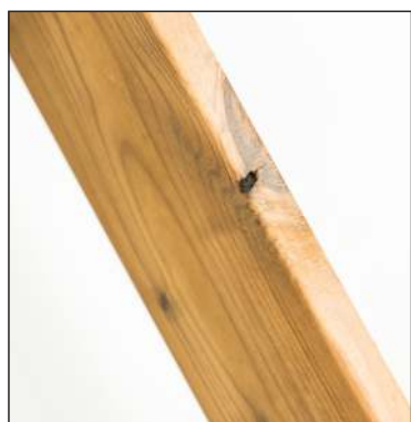
Malé volné suky na hranách prken jsou povoleny