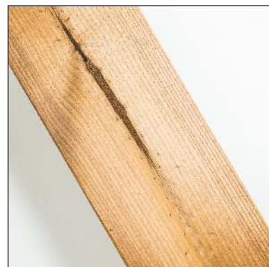
Dřeňové záběhy jsou povoleny