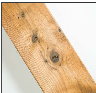
Praskliny v sucích jsou povoleny