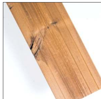
Praskliny kolem suků jsou povoleny