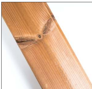
Praskliny v sucích jsou povoleny