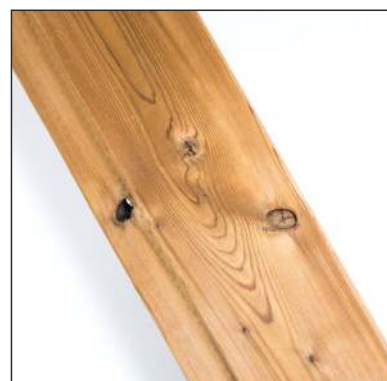
Malé otvory po vypadlých sucích jsou povoleny