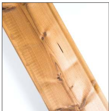
Smolníky jsou povoleny