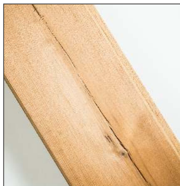
Malé praskliny na povrchu prken jsou povoleny

Produkty Thermowood vyrobené z borovice a smrku mají své charakteristické povolené znaky, které jsou uvedeny v ilustraci níže. Tyto typické znaky pro Thermowood nejsou považovány za vady.