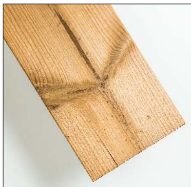
Trhliny na koncích prken jsou povoleny